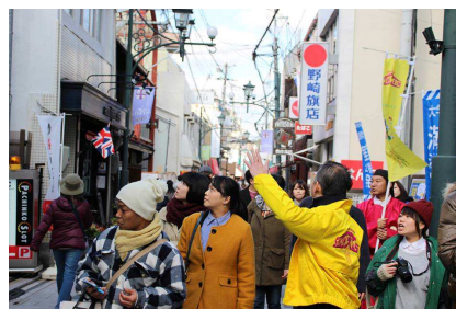
商店街まち歩きの様子

【開催日時】11月11日(土) : ①16:00~、②19:00~ ※①は招待者のみ 11月12日(日) : ③13:00~、④16:00~