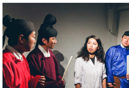
天平衣装を使った前回の演劇の様子

今回の演劇の設定は、3人の女子大生が1300年の時を超え現代に現れるというもの。『観光客でにぎわう現代の商店街は、奈良時代からやってきた彼女たちにどう映るのか?「あたりまえな日常」の素晴らしさに気づける商店街を舞台にしたファンタジー』として、実際の商店街店舗の店主や、奈良で活躍する劇団員、奈良の大学生などで上演されます。