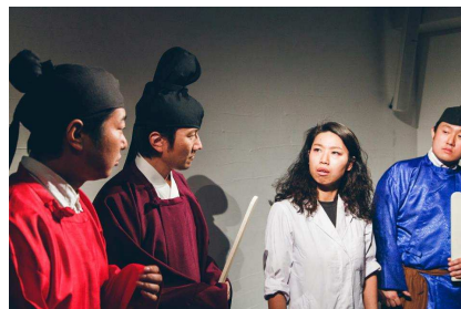
天平衣装を使った前回の演劇の様子

今回の演劇の設定は、3人の女子大生が1300年の時を超え現代に現れるというもの。『観光客でにぎわう現代の商店街は、奈良時代からやってきた彼女たちにどう映るのか?「あたりまえな日常」の素晴らしさに気づける商店街を舞台にしたファンタジー』として、実際の商店街店舗の店主や、奈良で活躍する劇団員、奈良の大学生などで上演されます。