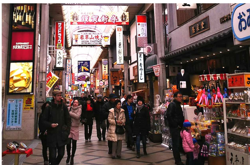
写真. 商店街の様子

格安航空会社(LCC)等の新規就航・増便、ビザ緩和や消費税免税制度拡充などの国の施策、海外プロモーション等の情報発信により、近年、日本を訪れる外国人観光客の急速な増加が見られます。奈良市においても著しい増加が見られ、奈良市が発行している「奈良市観光入込客数調査報告」によると、平成28年中に奈良市を訪れた外国人観光客は157.6万人とのことであり、前年(97.5万人)と比べると61.64%の増加が見られます(図)。JNTO(日本政府観光局)の発表によると平成28年に日本を訪れた外国人観光客は2403.9万人(前年比21.8%増)とのことです。奈良市の増加率は全国の増加率より大きい状態です。平成28年に奈良市内で行われた特別な企画としては、世界遺産である春日大社での20年に一度の社殿の修築事業である「第六十次 式年造替」や、日中韓の3か国で文化による発展を目指す都市を1都市ずつ選定して実施される国家プロジェクト「東アジア文化都市」が挙げられます。